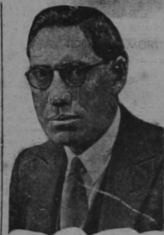
Don JULIO PEÑA MORUA

Ha regresado al país, después de una brillante jornada en que puso a prueba su gran talento y su gran capacidad financiera, el señor Gerente del Banco Nacional de Costa Rica, don Julio Peña. Nosotros no podemos limitarnos a consignar una escueta nota social, porque su misión tiene alcances trascendentales. Logró mejorar las condiciones del primer contrato de empréstito celebrado con el Eixmbank; obtuvo mayor suma de dólares y mientras se redujo y limitó la contribución nuestra en la obra de la carretera interamericana; obtuvo dineros para